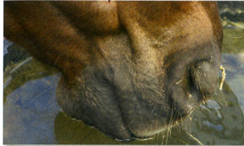
Drinkwater om de 4 dagen verversen