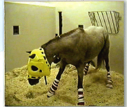
Paard getroffen door het West-Nijlvirus

Van de paarden die bezwijken aan de neurologische vorm van de ziekte sterft tussen de 20% en 57% 1