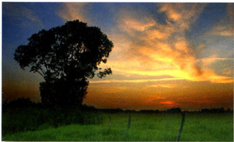
Paarden bij zonsopgang en zonsondergang, indien mogelijk, uit het weiland houden