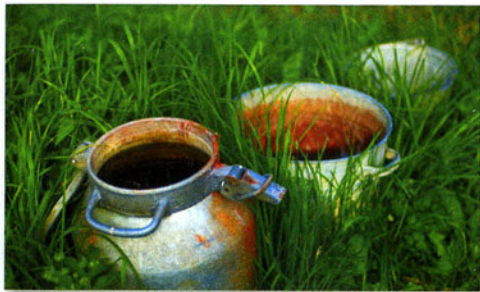
Containers verwijderen waarin zich water kan verzamelen